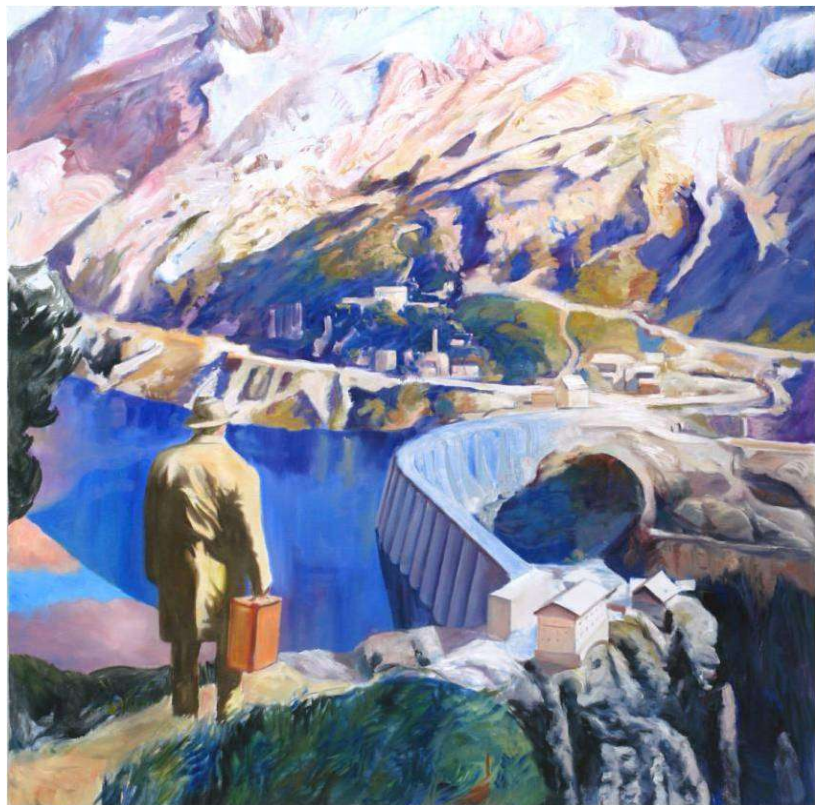
Thomas Beecht „Flucht in die Berge“, 2009 Öl auf Leinwand, 170 x 170 cm, Privatsammlung

Die lichten Häuser nahe der Talsperre stemmen sich gegen das Dunkel des Abgrundes auf der Talseite. Um dem unheimlich anmutenden Hang zu entkommen, wandert der Blick rasch zur Bildmitte, um sich sogleich auf dem glatten Spiegel des azurblauen Wassers auszurufen.